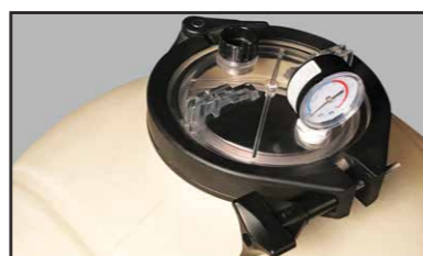
Manómetro de fácil lectura por un control sencillo.