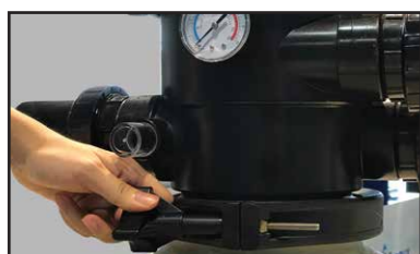
Cierre de una pieza con palomilla de rosca. Diseñado para facilitar la instalación y el mantenimiento sin herramientas

El diseño innovador y la tecnología aplicada de Emaux proporcionan a los filtros Max un alto rendimiento de filtración, agua perfectamente limpia. Fabricados en una sola pieza mediante proceso de soplado de polietileno de alta densidad para garantizar la máxima resistencia y fiabilidad. Este material es económico, resistente y compatible con amplia variedad de productos químicos incluyendo ácidos y bases.