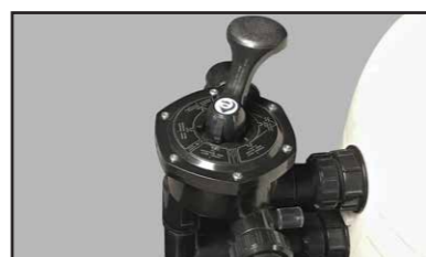
Equipado con una válvula selectora de 6 vías.